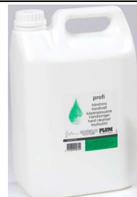
5 litran kannu